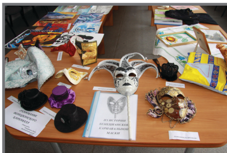
Бондаренко Ксения, 5 курс, ИФ «Карнавальные маски»