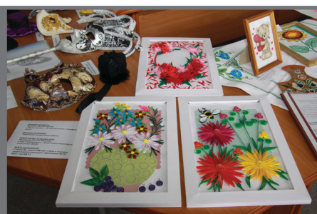
Студенты 3 курса, дошкольной педагогики, ИПиП