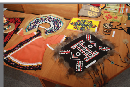
Киле Т., Бархатова М., 5 курс, ФТЭД