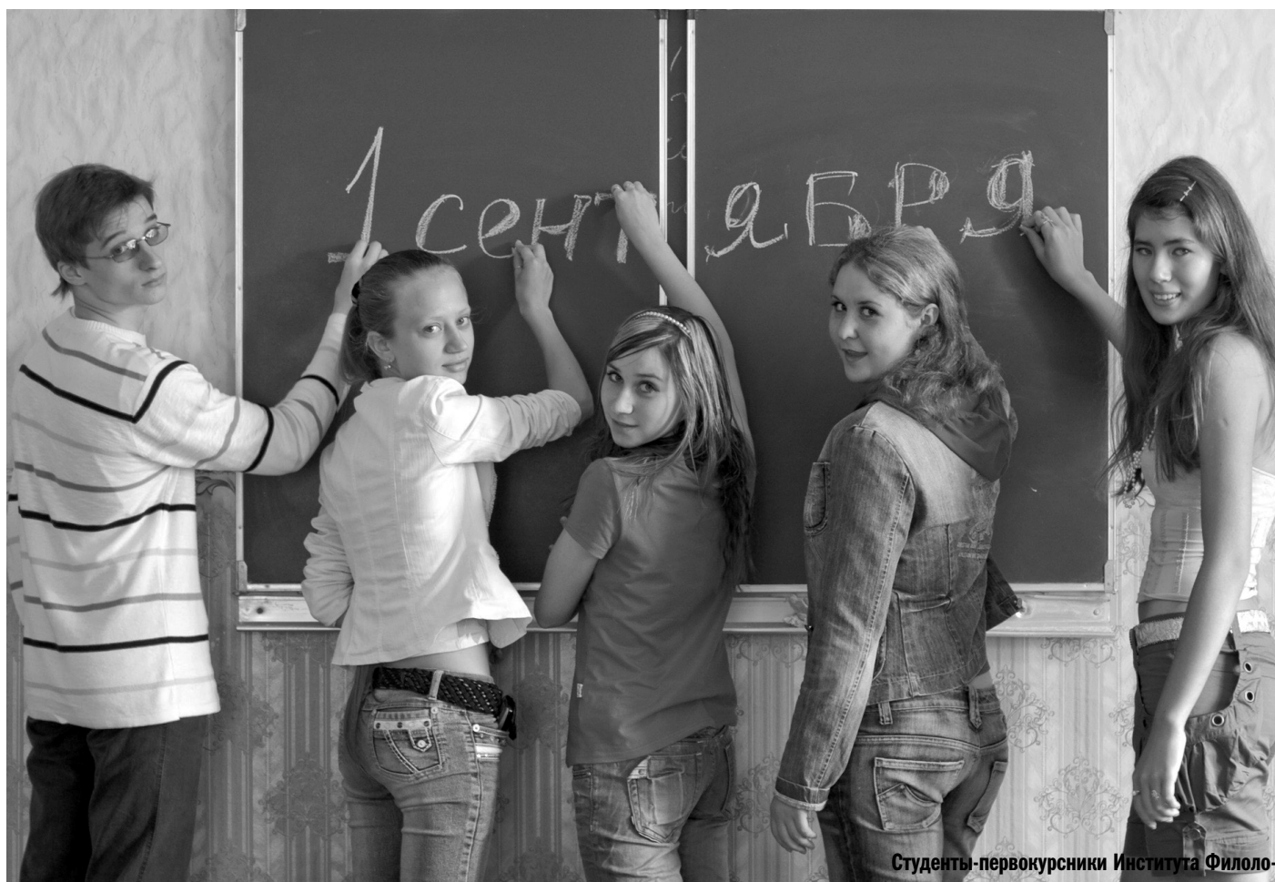
Студенты-первокурсники Института Филоло-

Студент — это не сосуд, который надо заполнить знаниями, а факел, который нужно зажечь